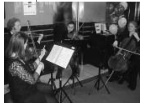
Le miniconcert donné par le Quatuor de la Montérégie lors du coquetel du Marathon Standard Life.