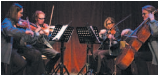
Le Quatuor de la Montérégie lors de la dernière matinée découverte de la saison 2003-2004.

Le dimanche 21 mars dernier, le Quatuor de la Montérégie a su nous surprendre par l'étendue de son répertoire. En effet, la dernière matinée découverte de la saison 2003-2004 nous a fait découvrir et redécouvrir la musique nord-américaine. De Jimmy Hendrix à Antonin Dvorak, en passant par des extraits du film West Side Story , les musiciens affichaient un réel plaisir à exécuter de la musique de jazz, de Broadway, de films, du classique et du pop-rock. La variété des pièces a indéniablement touché un public qui fut amené à se